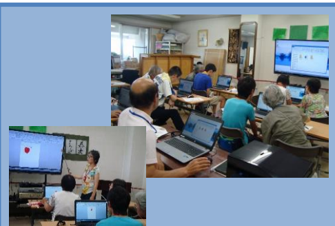
パソコン講習会の写真です。この日はWord でイラストを作成し、それを印刷してガラスびんに張り付けました。リンゴや犬やクマなどを描きました。